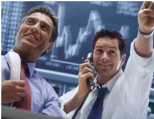
DELTA Absolute Return