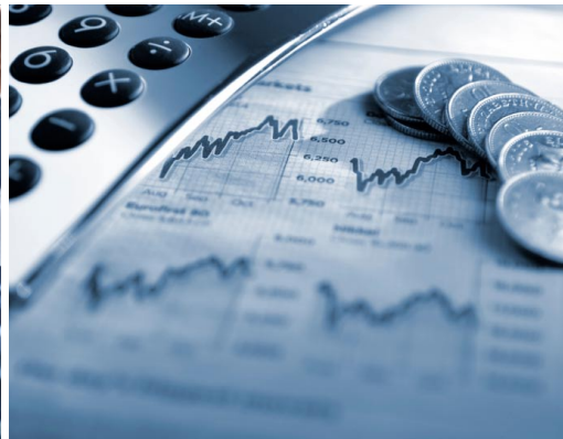
DELTA Ass Global